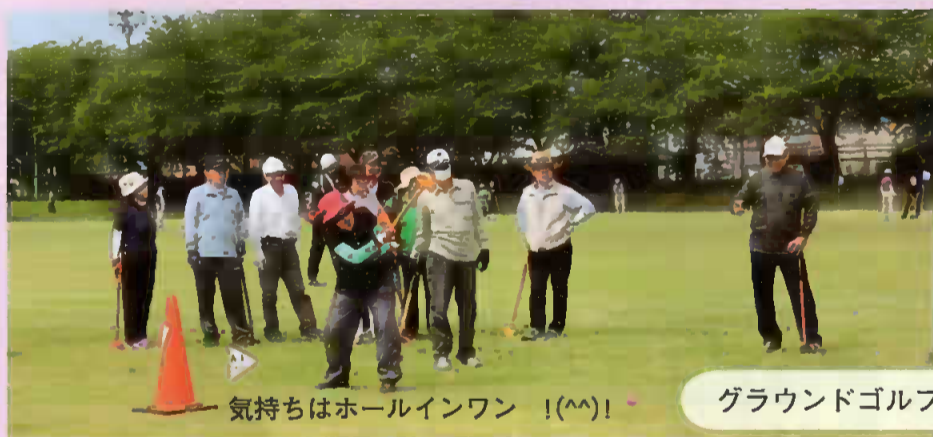
気持ちはホールインワン!(^^)!