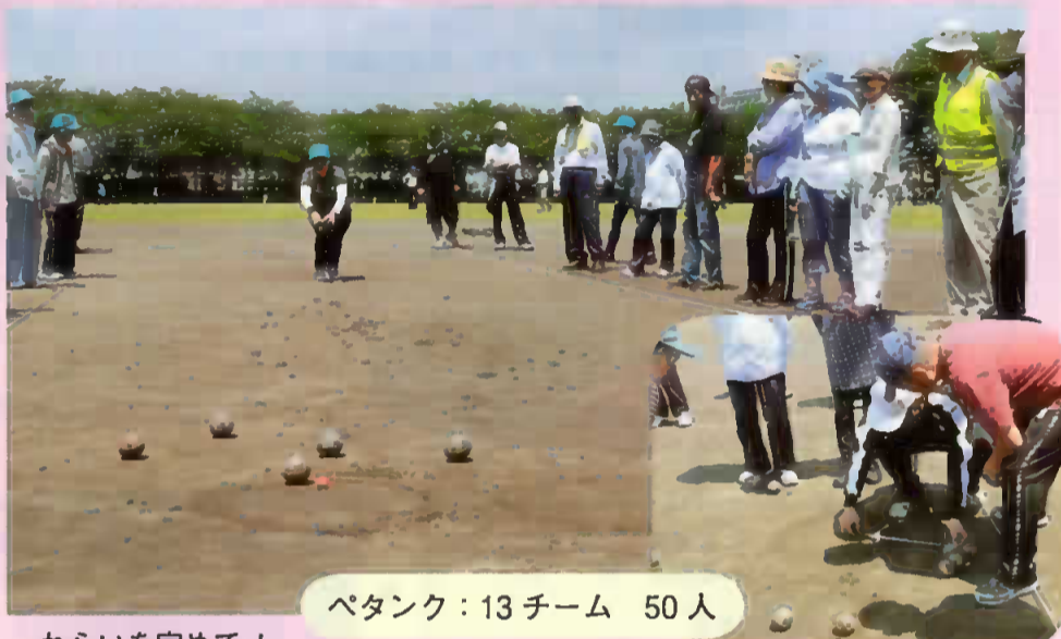
ペタンク：13チーム 50人