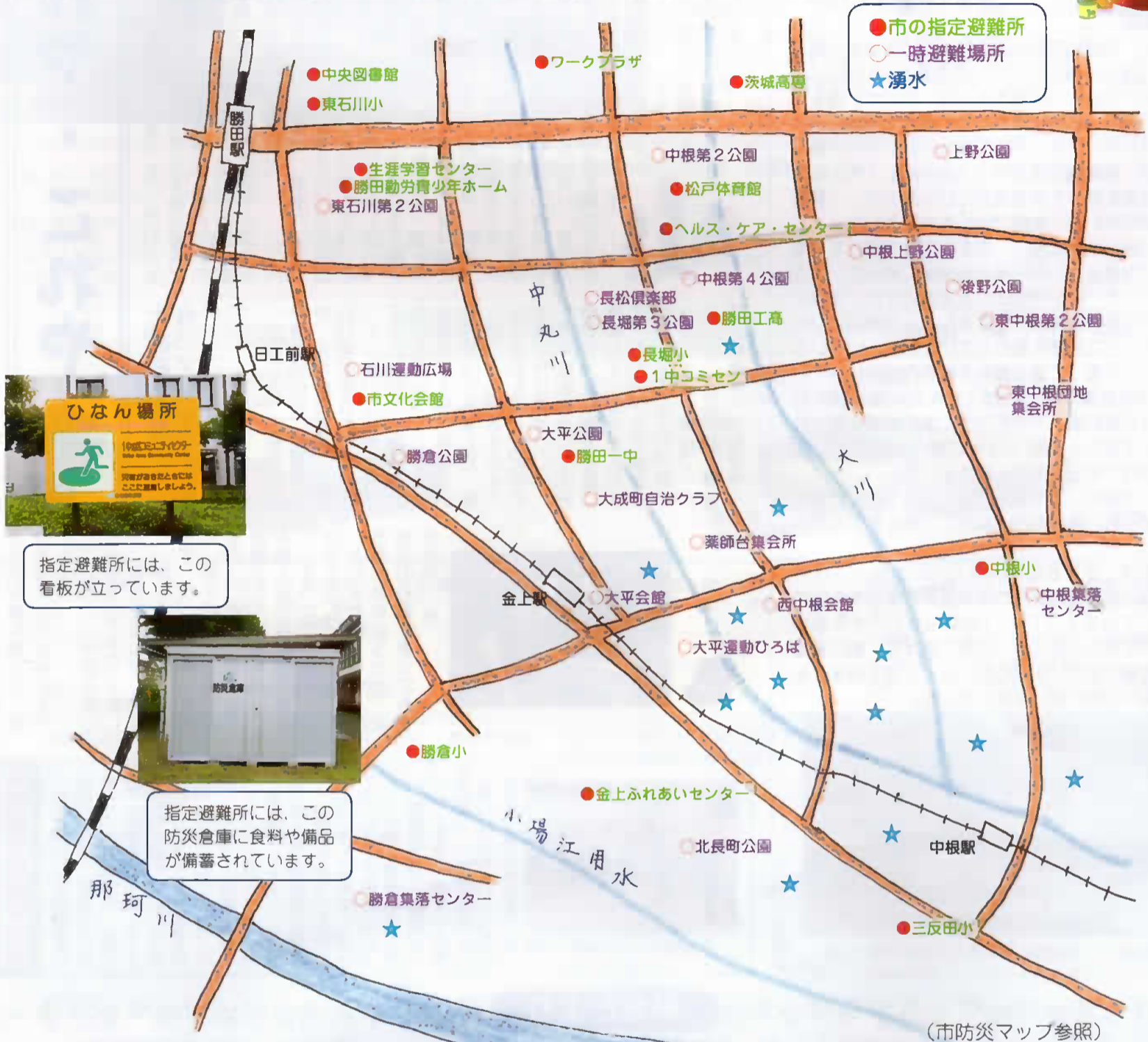
(市防災マップ参照)

防災の日には、各自治会で一時避難場所に集合してから指定避難所に移動したり、炊き出しをしたりなどの避難訓練を行っています。この地図は、市で指定した避難所及び自治会で設定した主な一時避難場所ですから、地域の避難訓練に参加して、いざという時どのように対応したら良いかを確認しておいてください。(詳しく知りたい方は、各地域の自治会役員や1中コミセン・市生活安全課などにお問い合わせください)