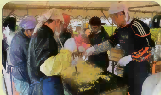
お客さん待ってるよ〜