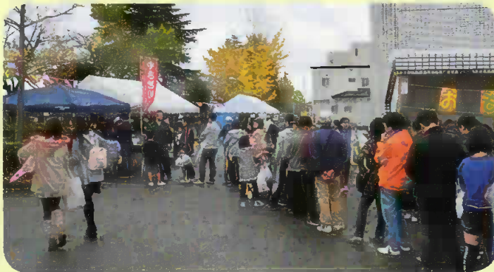
匂いに誘われて“やきとり”コーナー