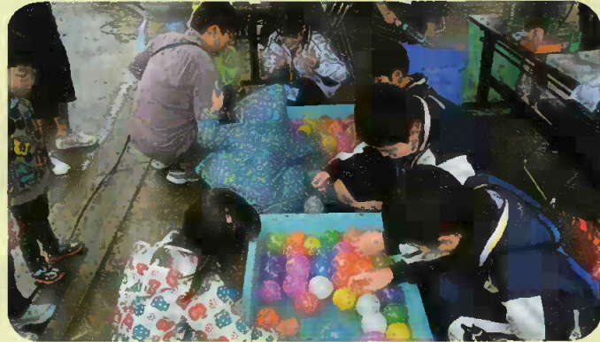
なかなかとれない!