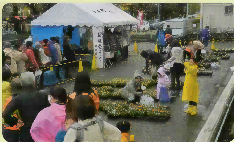
どの花にしようかな〜