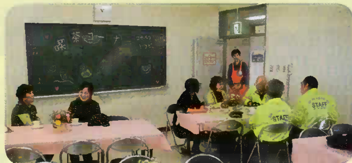
コーヒーでひと休み