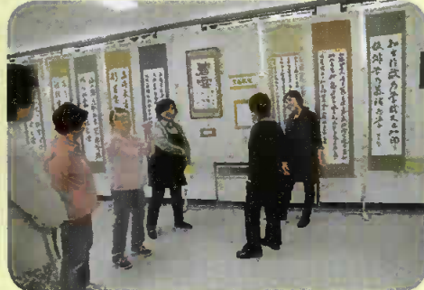
いい筆遣いですね!