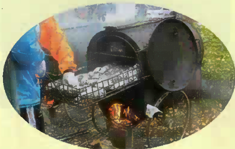
“焼芋” いっぱい焼けたよ〜