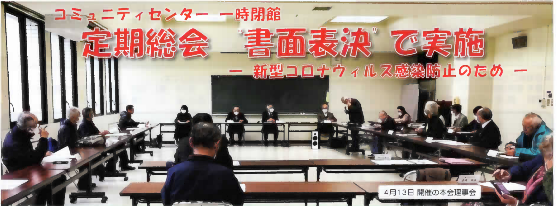
4月13日 開催の本会理事会

4月7日の緊急事態宣言により、コミュニティセンターは臨時閉館、各種イベントは延期・中止となりました。4月25日に開催予定だった令和2年度定期総会も実施方法を変更。4月13日の本会理事会で総会の議案を説明の上、代議員に周知し、「書面表決」を行いました。その結果、すべての議案は原案通り可決されました。