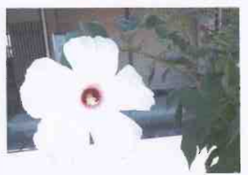
道路樹木橋の芙蓉(松戸南班8月3日撮影)

○市の継続事業として国庫補助で中丸川流域の親水性公園化が一層進み長堀ローズ班の西端の山地は駐車スペースとなります 市のヒアリングに対し トンボ王国(四国四万十川流域にあり)のような楽しい公園にしたらと進言しました ○魁寮の南側道路に防犯灯を一基設置のために 東電が引き込み線用電柱を3本立ててくれます