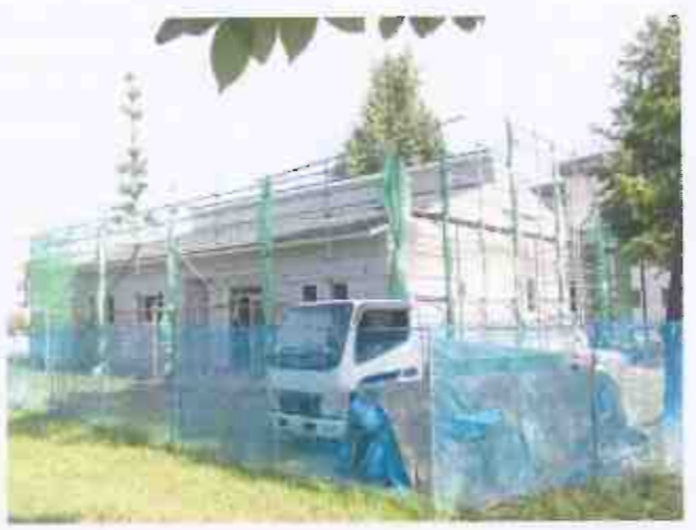
外側はほぼ完成した建築中の倶楽部(8月4日撮影)